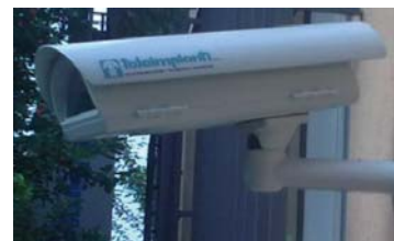
Una telecamera di videosorveglianza realizzata dalla Teleimpianti